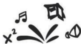
WRS und RS Oberes Kinzigtal