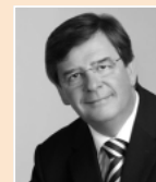
Willi Stächele MdL, Minister a.D., Gründungsmitglied des Kuratoriums