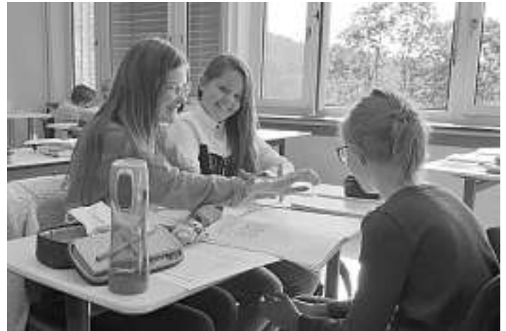
Das virtuelle Kennenlernen gibt Einblicke in den Unterricht.