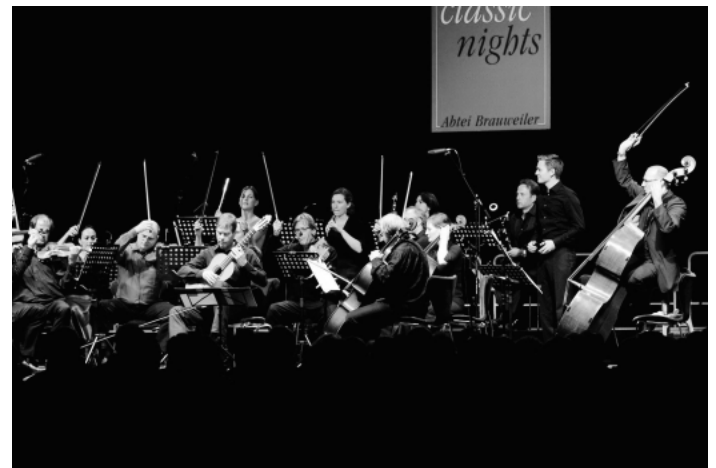
CAMERATA EUROPEANA