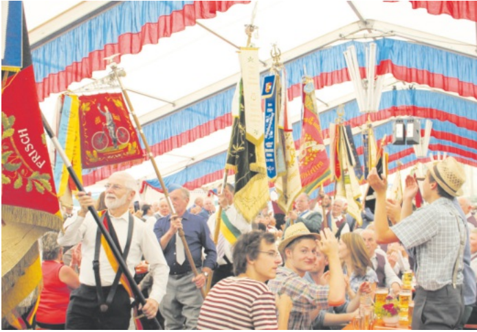
Fahneeinmarsch der Traditionsvereine nach dem Festumzug 2013