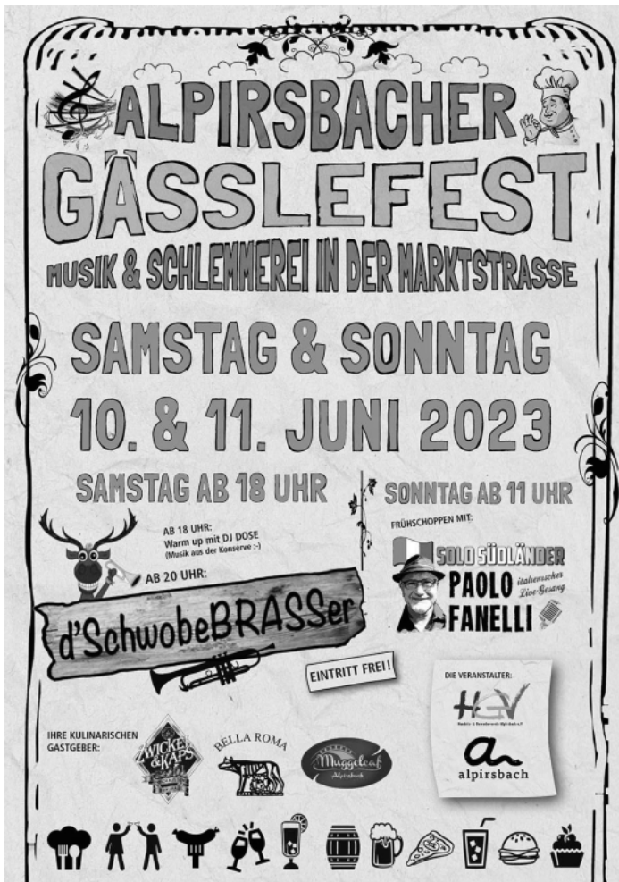
Gute Unterhaltung auf unserem Gässlefest wünscht der HGV Alpirsbach

Frühschoppen inklusive unterhaltsamer italienischer Livemusik von Paolo Vanelli weiter. Der Eintritt ist an beiden Tagen frei.