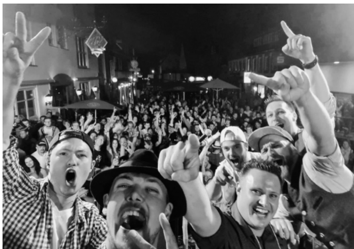
Die SchwobeBRASSer werden für gute Stimmung sorgen