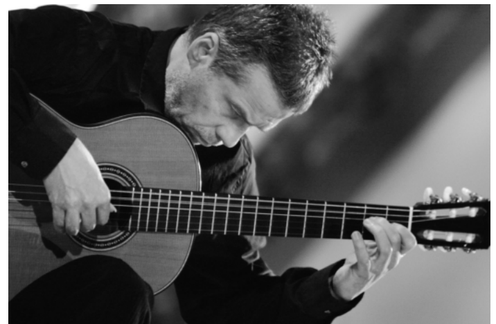
Friedemann Wuttke