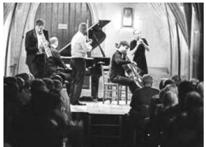
Spark - Die klassische Band

Besonders freuen wir uns auf das Konzert des Stuttgarter Kammerorchesters. Das Orchester ist für die Alpirsbacher Kreuzgangkonzerte ein alter Bekannter. 1952 traten sie unter dem legendären Dirigenten und Gründer Karl Münchinger das