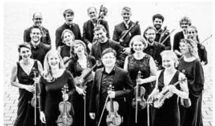
Stuttgarter Kammerorchester