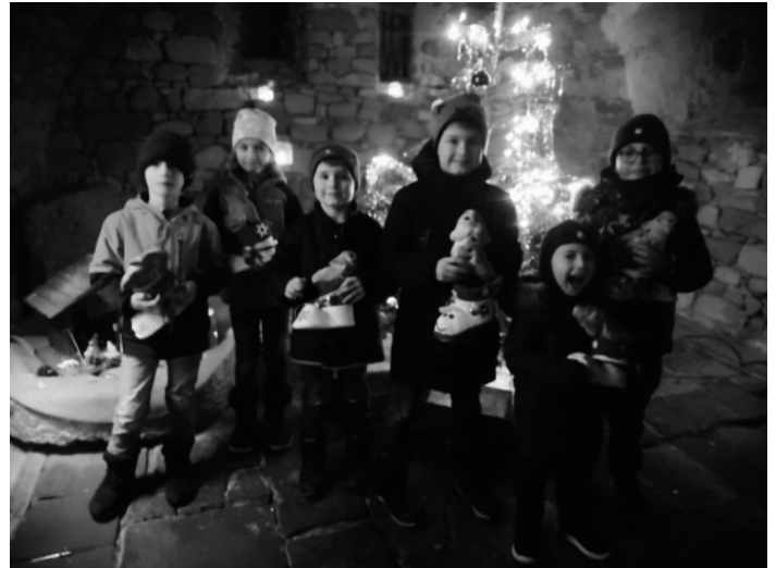
Die Kinder freuten sich über prall gefüllte Nikolausstiefel!

Das Weihnachtszimmer ist am 31. Dezember und am 6. Januar geöffnet jeweils von 14-17 Uhr. Wir freuen uns auf viele Besucher!