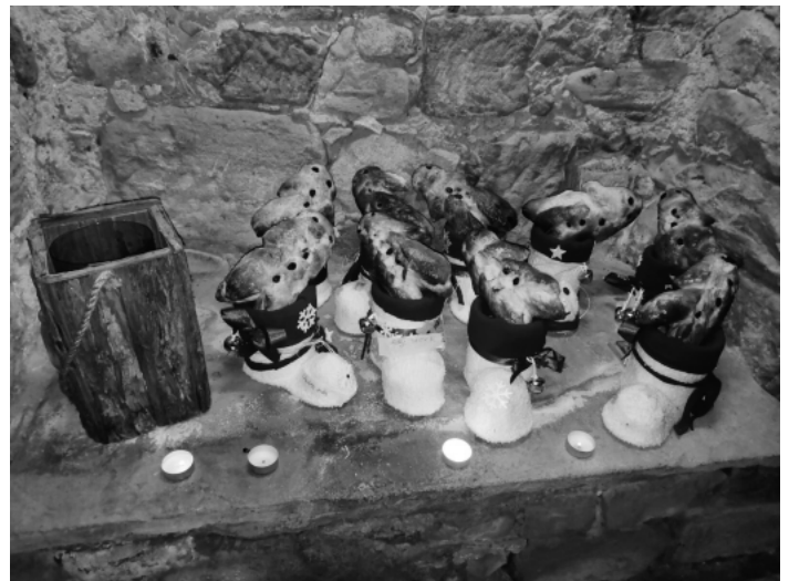
Nikolausstiefel mit leckerer Füllung!

Ihr lokaler Werbepartner für Handel, Handwerk und Gewerbe.