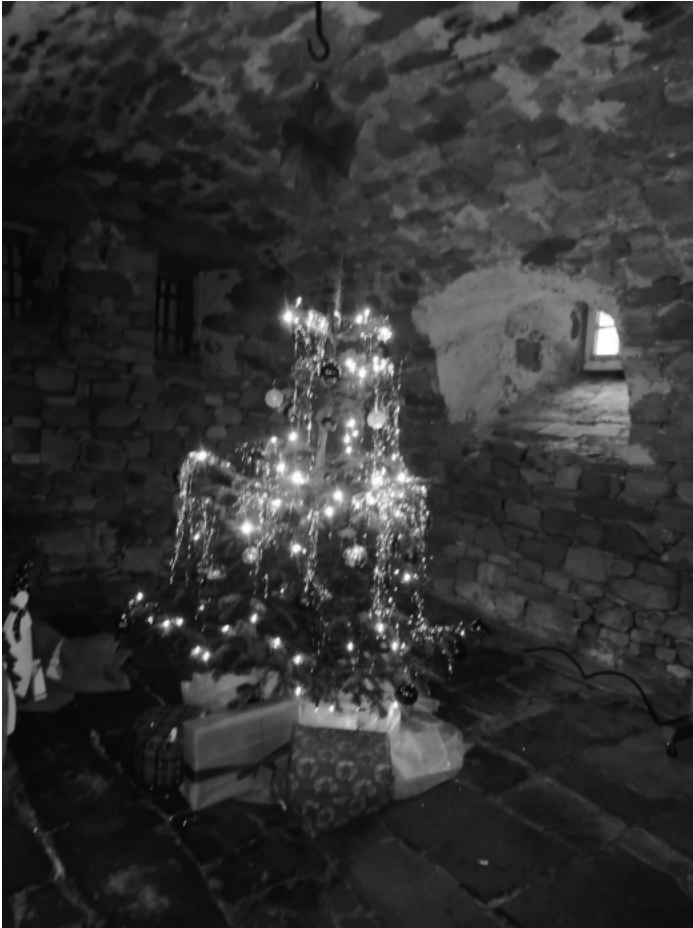
Das Weihnachtszimmer hat noch bis 6. Januar geöffnet!