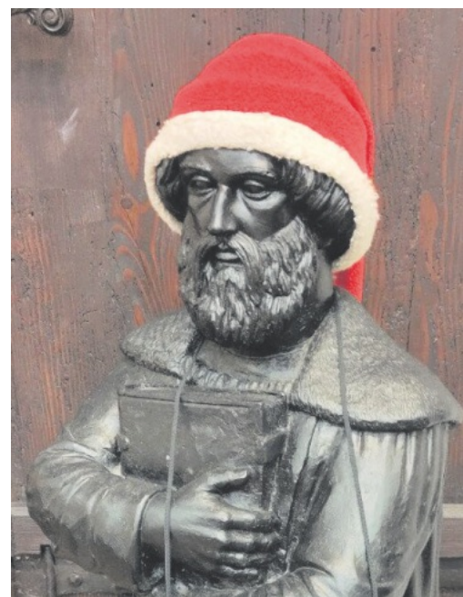
Johannes Gutenberg mit Weihnachtsmütze

Wir freuen uns auf Ihren Besuch ab 7. Januar 2024 wieder jeden Sonntag von 14 bis 17 Uhr.